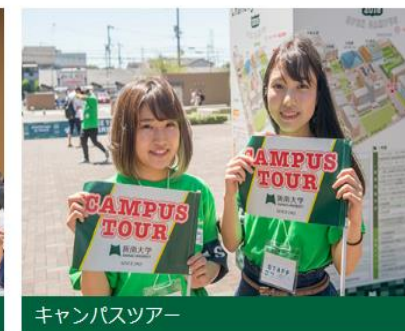
キャンパスツアー